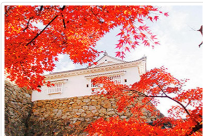
紅葉名所鶴山公園

園內的重大設施花迴廊：環繞一周約有1公里的距離，與通過地面25米的附帶屋頂的展望走廊相連接，不論季節和天氣在植物園全年都可以遊覽觀光。百合為主題花，全年展示。並且為日本唯一保有並展示全日本的野生百合品種15種的地方。「花之丘」是園內最佳的觀賞點，以雄偉的大山為背景綻放的花的風景真的是美不勝收，也是最受歡迎的攝影之地。