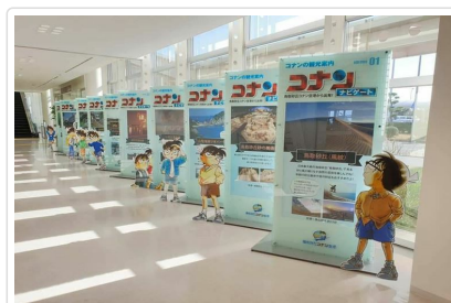
鳥取砂丘柯南空港