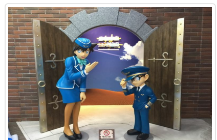
鳥取砂丘柯南空港