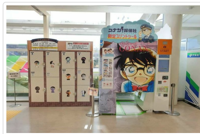
鳥取砂丘柯南空港