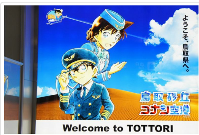
鳥取砂丘柯南空港