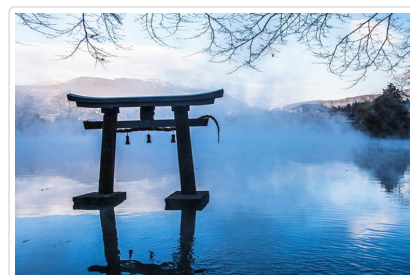
金鱗湖(晨霧和出泉之鄉)

🍴 餐食 早餐:飯店內用 午餐:豐後牛料理(不吃牛可改)¥2500-3000 晚餐:飯店內會席料理或自助餐