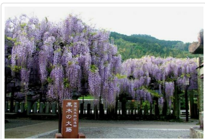
素盞鳴神社(紫藤名所)

行程交通住宿及旅遊點儘量忠於原行程，有時會因賞花人潮及飯店確認關係，行程前後更動或互換觀光點或住宿地區順序調整，如遇特殊情況如船、交通阻塞、觀光點休假、住宿飯店調整或其它不可抗拒之現象，行程安排以當地為主，情非得已，懇請諒解。並請於報名時特別留意。