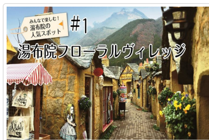
湯布院(湯之坪街道散策)