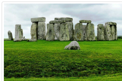
不思議古巨石奇觀