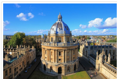
牛津波德里安圖書館

【貼心提醒】 因防疫關係自2023年起，古巨石群入內參觀採用手機下載APP中文語音導覽的方式(免費)，若要使用當地的手持式導覽器須另付費2英磅(以景點公告為準)請您今日務必攜帶手機以利參觀。