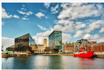
繁榮的港口—利物浦

續往孕育出偉大巨星披頭四樂團的城市—利物浦。位於英國北部的利物浦是英國體育與文化發展的中心地之一，不但是全球知名的利物浦足球俱樂部的所在地、19世紀後期和20世紀初曾是英國最繁榮的港口，海運事業發達，留下珍貴又有歷史價值的建築物。其中最著名的建築：◎碼頭頂Pier Head；以三大建築物著稱◎皇家利物大廈 ( Royal Liver Building ) ◎丘納德大廈 ( Cunard Building ) ◎利物浦港務大廈 ( Port of Liverpool Building ) 統稱為「三女神THREE GRACES」是利物浦的象徵，由一級古蹟舊建築重建，現已成為藝文潮地、人氣聚集之地、明信片最常出現的註冊商標！夜宿利物浦。