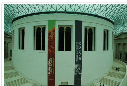
世界文明殿堂—大英博物館

全世界第一次博覽會的舉辦場所、工業革命的發源地，綠意盎然的倫敦，除帶動了全球現代化的發展，更展現昔日光榮歷史的風貌。全日專車遊覽霧都風光：參觀彙集世界文明遺跡的殿堂◎ 大英博物館 (入內參觀、★聘合格藍牌中文導遊專業導覽)，從埃及的木乃伊乃至希臘羅馬的石雕，琳瑯滿目地收藏，豐富個人視野。隨後拜訪英國歷代皇室加冕所在之皇室大教堂的◎ 西敏寺 ，途經欣賞議會制度起源的 英國國會大廈 及 大鵬鐘 ，中午前往CNN評選世界十大必逛市集之一的◎ 波羅市集 ，位於泰晤士河南岸的百年市集，是倫敦當地人也相當喜愛的市集唷!有包羅萬象的生鮮熟食，令人目不暇給，西班牙海鮮飯、義大利披薩、印度料理、德國豬腳&香腸、美式漢堡、越南河粉、法國手工優格、韓國炒年糕、希臘皮塔雞肉捲餅...等，多種異國料理等您來品嚐。若遇波羅市集休市則改前往倫敦知名的圓形廣場— 皮卡迪利圓環 Piccadilly Circus興建於1819年，昔為英國零售商店所在地，今為倫敦市區購物街的中心；附近的攝政街或琳瑯滿目的百貨公司櫥窗；滿足您購物的樂趣。)◎ 白金漢宮 —新古典主義建築風格是國家慶典和王室歡迎禮舉行場地之一、1863年起為英國皇室於倫敦之官邸、英國皇室的權力中心。