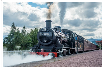
高地鐵道—火車頭外觀以搭乘為準