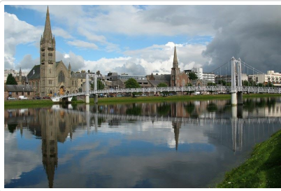
美麗蘇格蘭城市—茵佛尼斯

早上享用完早餐後，前往蘇格蘭最有歷史、最具魅力的旅遊景點：延著威士忌酒鄉之路，參觀 世界最高等級單一麥威士忌製作過程 於酒廠★ 品酒 。午後前往愛丁堡威瓦利 Edinburgh Waverley 火車站搭乘蘇格蘭★ 高地鐵道 (預計安排英國國鐵 GR6307 16:33+++20:04時間以實際搭乘為準)，沿途欣賞於冰河時期剝蝕所形成的特殊地型風貌，火車路線穿越蒼穹的高地，冰河剝蝕所形成的地貌組成獨特的景觀，英國北方風景最優美的地區之一，隨著高地火車的路線您將發現沿途蘇格蘭地貌壯闊的美景。續夜宿於美麗的茵佛尼斯(阿維莫爾AVIEMORE地區)。註：蘇格蘭地區，因氣候特性冬季寒冷時間較長，夏季炎熱時間較短，且夏季日夜溫差大夜晚涼爽，因此部份飯店房間僅設置冬天必備之暖氣設備，可能無冷氣設備，敬請知悉。