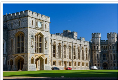
伊利莎白女王二世最愛的溫莎古堡

今日早餐後前往★ 溫莎古堡 （含可攜式中文Audio Guide自由聆聽精彩介紹），伊利莎白女王二世最愛的行宮，內部珍藏歷代皇室收藏品，參觀並聆聽溫莎公爵那一段只愛美人不愛江山的皇室愛情故事。並參觀許多英國皇室舉行婚禮大典的◎聖喬治禮拜堂，一同沈浸在令人無可抵擋的英國皇室魅力；古堡周圍的溫莎小鎮，鎮上有步行街佈滿商店、咖啡廳及餐廳，逛累的話不妨喝杯咖啡細細品嚐英倫的皇家風情。（註：若遇皇室活動溫莎古堡不對外開放或遇維修無法入內，則改漫步於溫莎小鎮參觀、並退古堡門票費每人25英磅）爾後專車載著滿滿回憶前往機場搭乘豪華班機返回桃園。來回【豪華經濟艙】