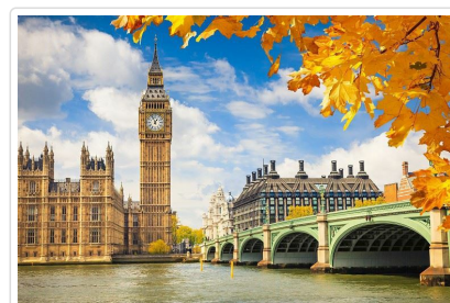
國會大廈及大鵬鐘