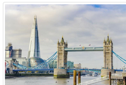
遊船盡覽英倫風情

貼心規劃 波羅市集是CNN評選世界十大必逛市集，我們特別保留一點時間您自由選擇想吃的美食，晚餐再安排人氣龍蝦堡為當地人瘋狂追逐的新興餐廳，一起大塊朵頤!